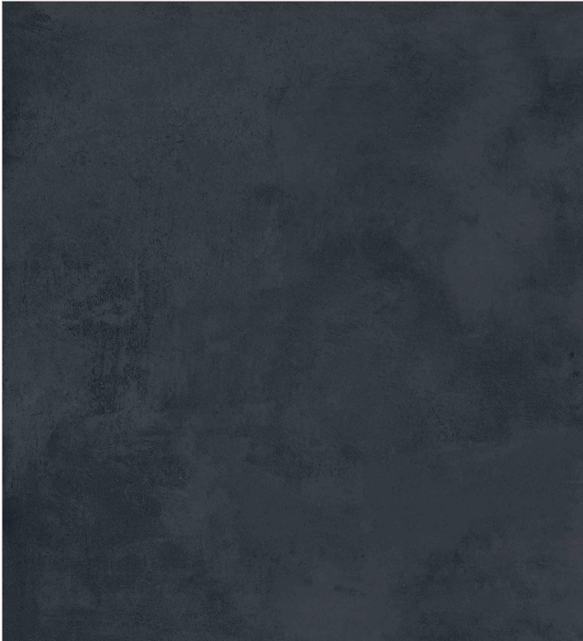
FSZ Bonn anthrazit 800x800 mm