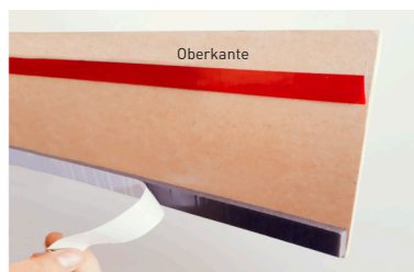
Klebestreifen abziehen und direkt an die Wand kleben