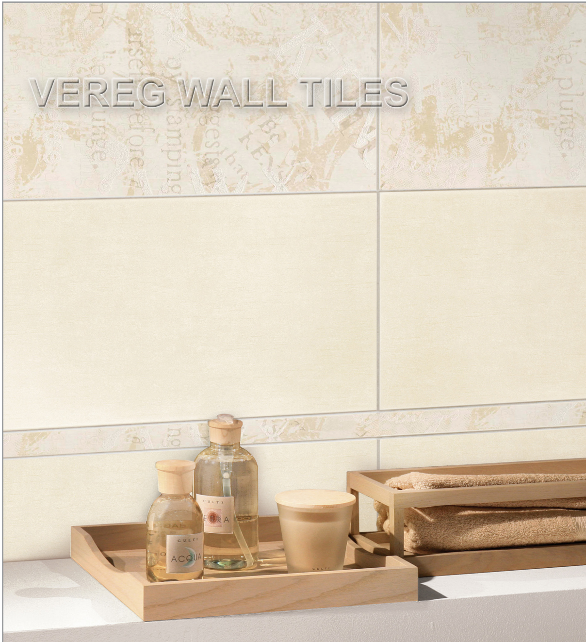
WFL weiß matt 300x600