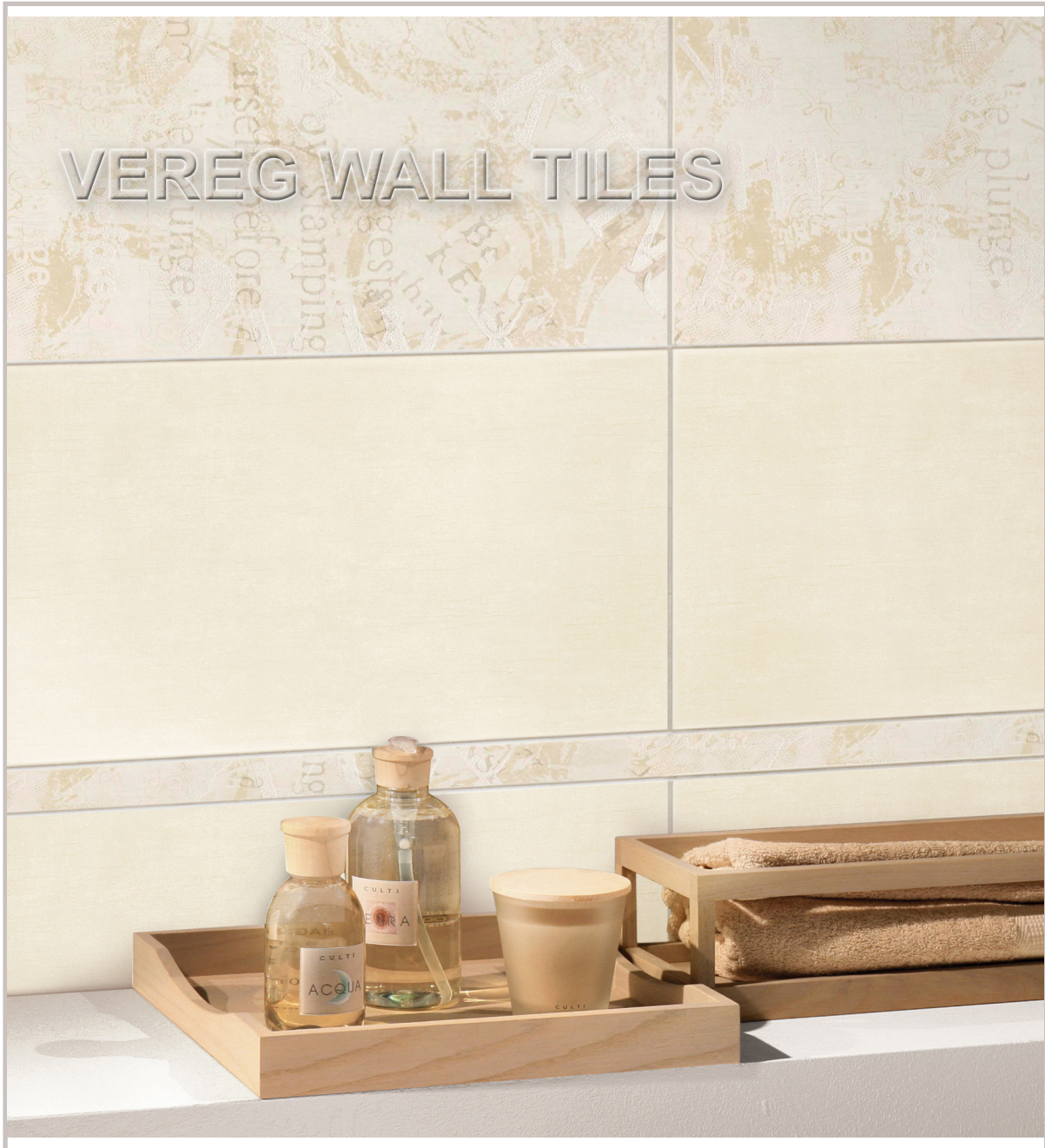
WFL Tania grau 200x250