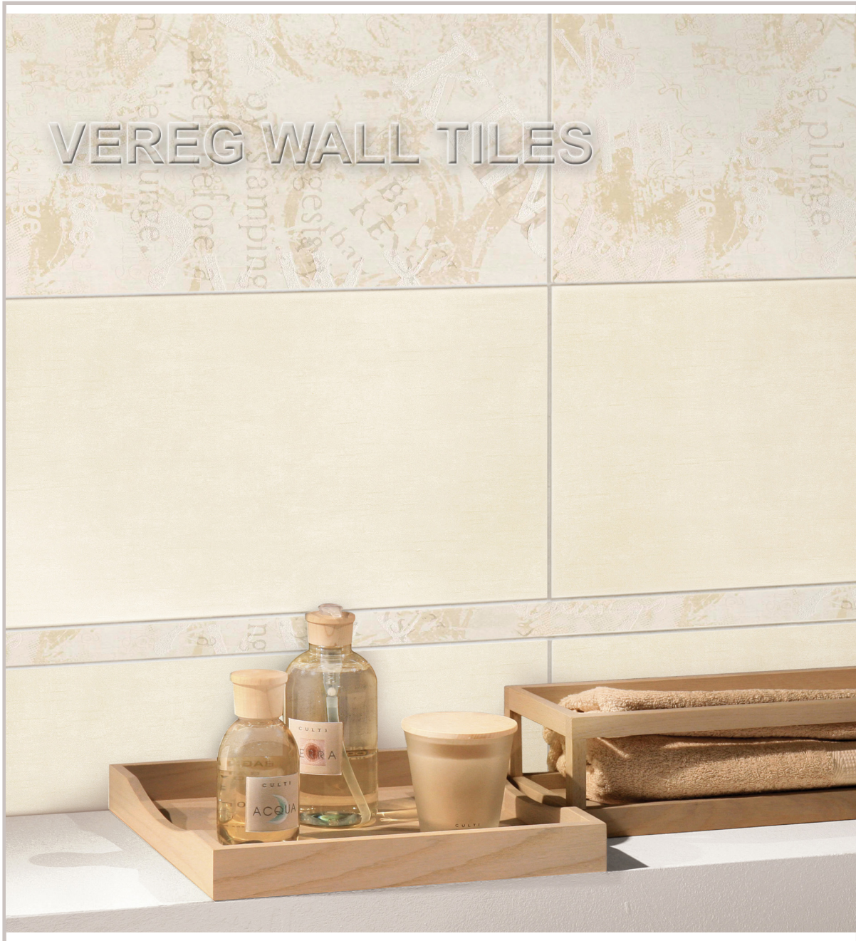
WFL weiss glänzend 250x500