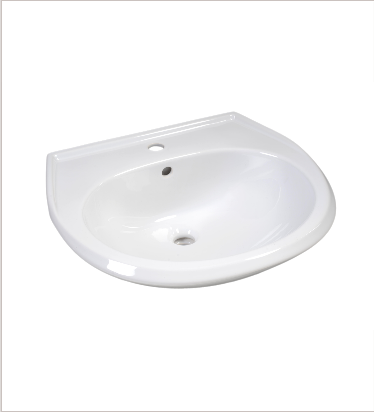
Waschbecken DNP 60 cm