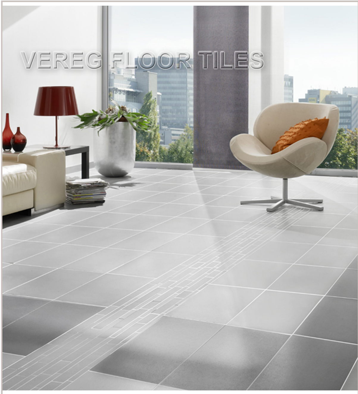
BFL FSZ Mars grey 308x615