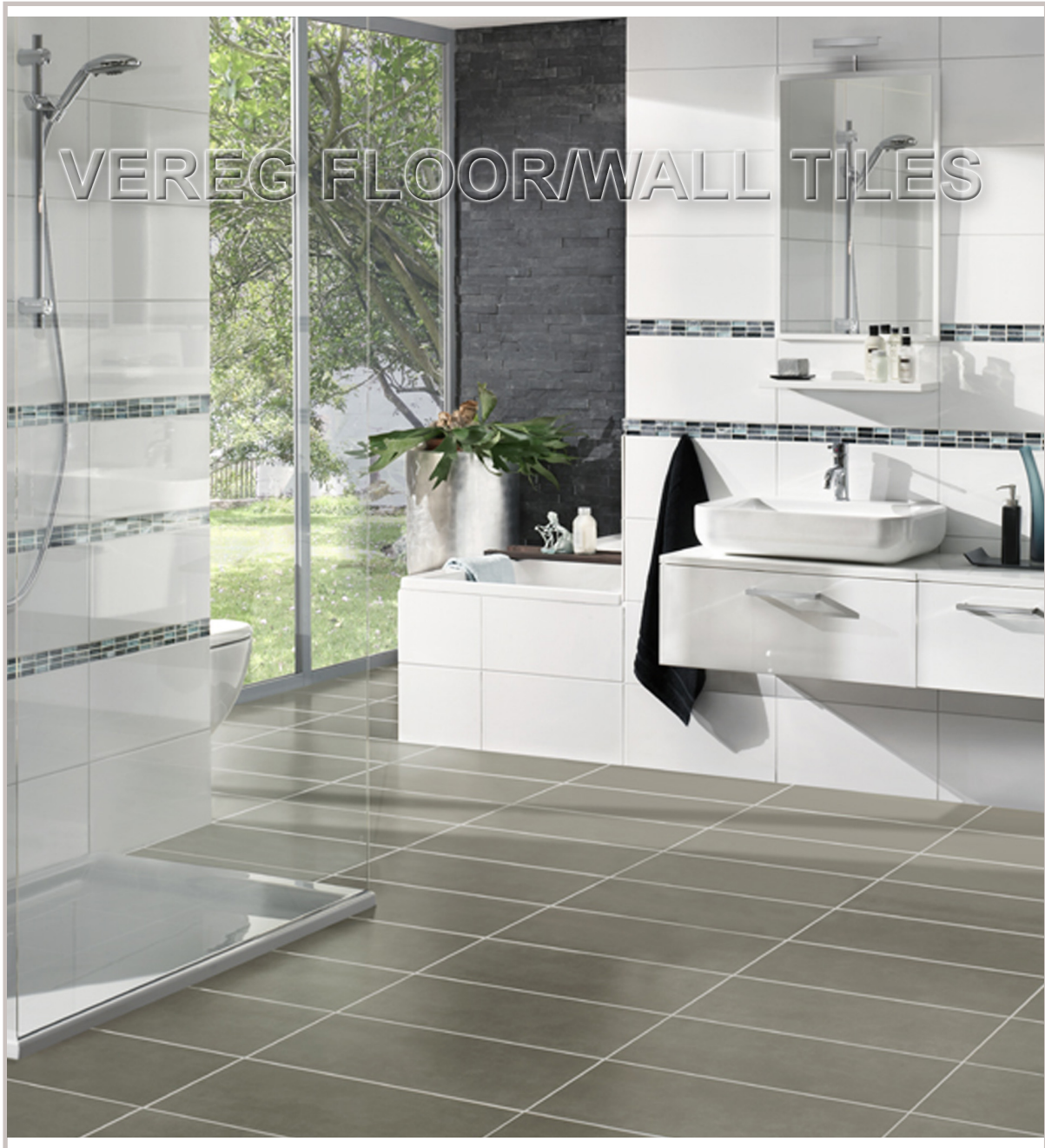
FSZ TRACK grey 450x900